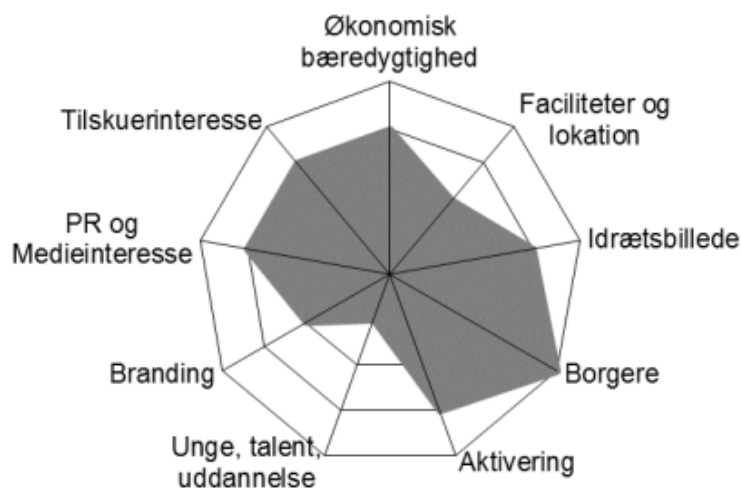
Figur 1. Visualiseringsmodel af eventvurderingen

Eventvurderingen viser bl.a., at Helsingør Sejlklub ønsker at udvikle og udbrede begivenheden, så den kan tiltrække borgere, som ikke normalt færdes i havneområdet. Det vil de gøre ved hjælp af sideevents og markedsføring af begivenheden. Sideeventsene byder bl.a. på en række opvisninger og aktiviteter på Helsingør Nordhavn. Herunder en gratis koncert, og en telt-landsby med underholdning og spisning for byens borgere og deltagerne.