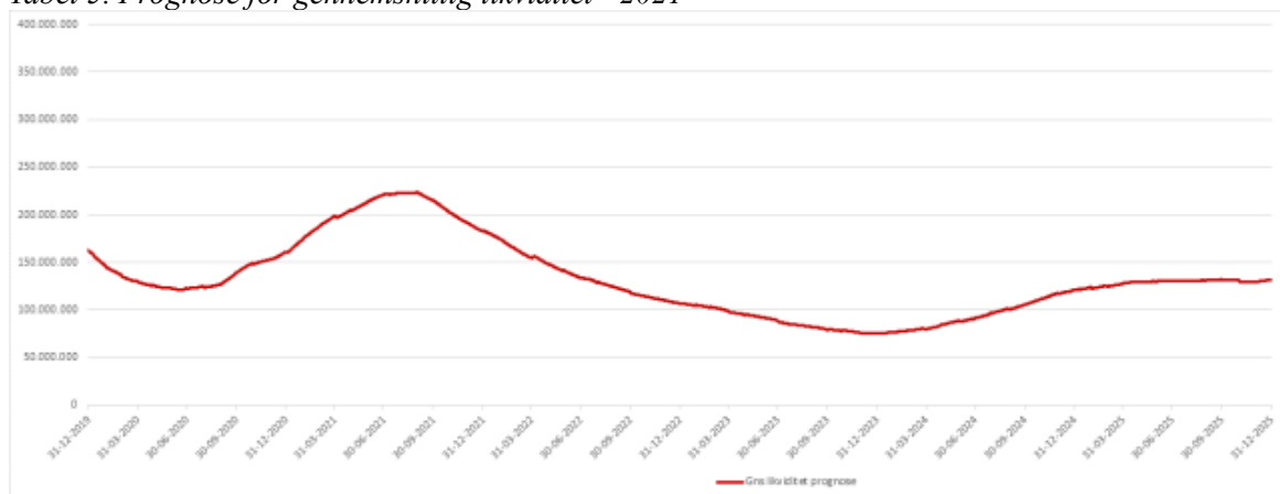
Tabel 5. Prognose for gennemsnitlig likviditet - 2021

Forventet regnskab på driftssiden og anlægssiden samt effekten af alle anbefalede omplaceringer og tillægsbevillinger, herunder overførslerne fra 2020 til 2021 og forventede udgifter til afregning med feriefonden (som følge af ny ferielov), er indarbejdet i likviditetsprognosen. Derudover er profil for deponering til sundhedshuset ændret på baggrund af anbefaling fra revision. Før var hele udgiften til deponering på 141.800.000 kr. indarbejdet i foråret 2021, men nu er den fordelt ligeligt over hele året.