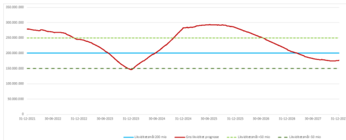
Tabel 4. Prognose for gennemsnitlig likviditet – primo 2022 til ultimo 2027

Den seneste forventede likviditetsudvikling fremgår af tabel 4 nedenfor.