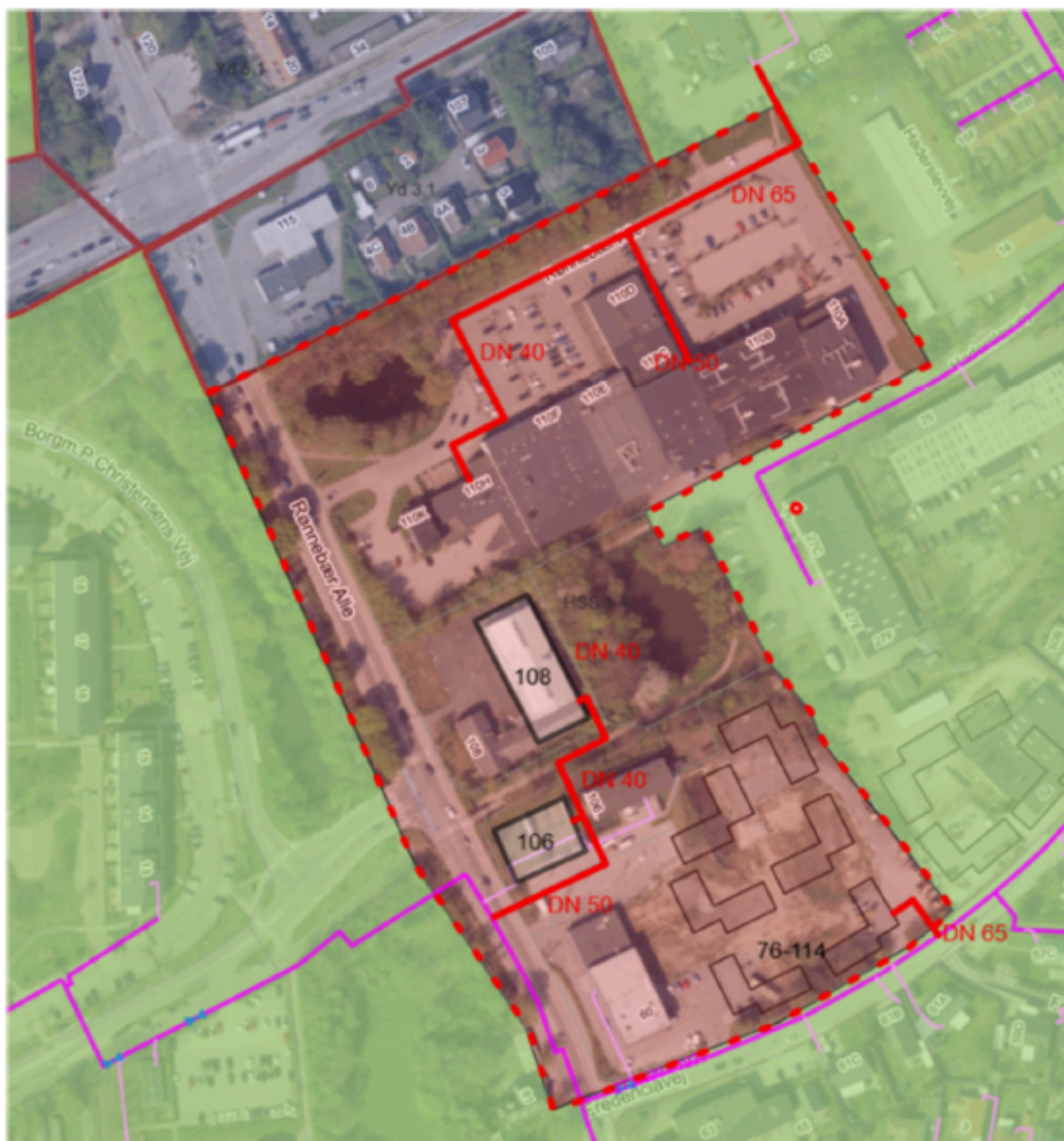
Figur 1 Projektområdet markeret ved de røde stiplede linjer. Lilla linjer: eksisterende fjernvarmenet, røde linjer: nyt planlagt ledningsnet.

Området er i dag udlagt til individuel naturgasforsyning, mens det omkringliggende område (grøn markering) er udlagt til fjernvarme.