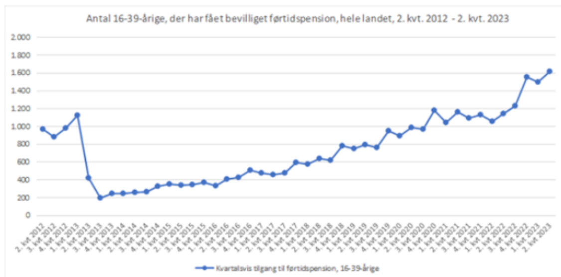
Figur 1. Kvartalsvis udvikling, hele landet

Nedenfor fremgår udviklingen i tilgang til førtidspension for 16-39-årige henholdsvis på landsplan og i Helsingør Kommune.